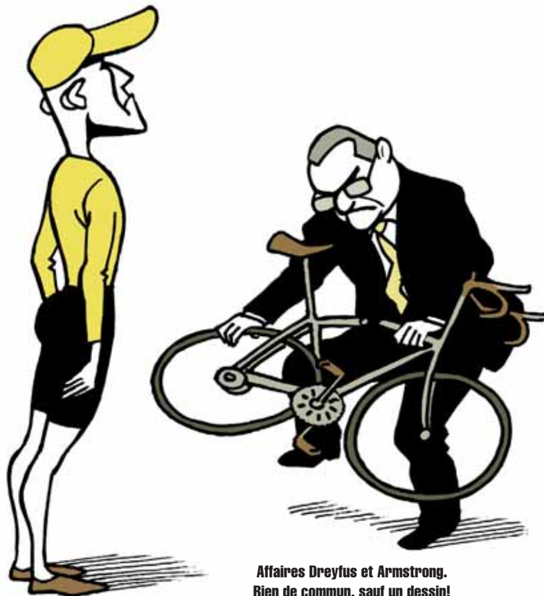
Affaires Dreyfus et Armstrong. Rien de commun, sauf un dessin!

Il n'y en a pas! L'esprit associe parfois des images sans se soucier de rationalité, je l'assume. Ces deux affaires ne se ressemblent en rien sinon par l'attention qu'elles ont suscitée et leur portée symbolique. J'ai fait aussi un troisième dessin d'Armstrong, au moment de ses aveux cette fois-ci. Il mon-