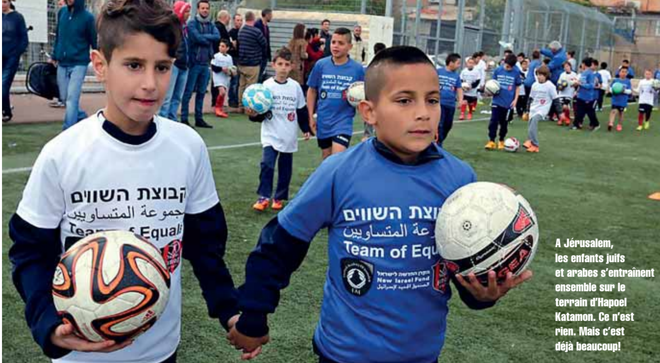
A Jérusalem, les enfants juifs et arabes s'entraînent ensemble sur le terrain d'Hapoel Katamon. Ce n'est rien. Mais c'est déjà beaucoup!

le Parlement israélien). Elle s'est fait arrêter par la police et dut passer la nuit au poste. Drôle de situation, tout de même. Mais nous sommes habitués aux grands écarts de ce type. Vous devez savoir qu'en Israël le service militaire est encore obligatoire: trois ans pour les garçons, deux ans pour les filles. Quand deux de nos fils furent nommés officiers, nous avons ressenti de la fierté, ma femme et moi. En même temps, nous vivions dans l'angoisse qu'il leur arrive quelque chose. Puis l'aîné était en mission au Liban, moi de mon côté je manifestais et dessinais contre le conflit. Vous le voyez, la politique s'invite partout dans ce pays. Même au cœur des familles.