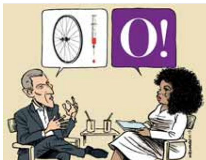
Histoire d'O, évidemment!

olympiques ou la coupe du monde de football par exemple. Et surtout au fait que ces compétitions se prêtent facilement à toutes les récupérations politiques. On peut se servir du sport pour démontrer à peu près tout ce que l'on veut. Je sais de quoi je parle, je l'ai fait moi-même! En mai 2015, j'ai représenté Israël et la Palestine en tenue de football. Le Palestinien s'insurgeait de la conduite de l'Israélien. Il criait «hors-jeu!» à l'arbitre qui symbolisait la communauté internationale et, pour le coup, restait totalement impassible.